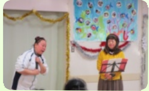
本格的なゴスペルによるクリスマスソング