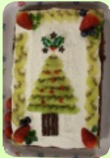
今年のクリスマスケーキ(栄養科)