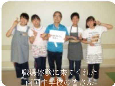
職場体験に来てくれた 両国中学校の皆さん

十一月七日(火)から三日間、中学生の職場体験がありました。センターの様々な職種の職員から、それぞれの仕事についてのレクチャーを受けました。医師、薬剤師、リハビリ関係、福祉関係の仕事に就きたいなどの感想がありました。(療育部)