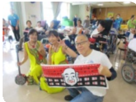
三線と心地よい声で魅了されました！