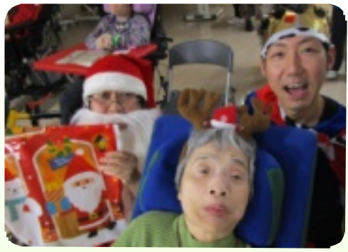
サンタさんからプレゼントももらいました！