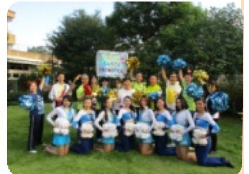
チャアダンスの皆さんと記念撮影