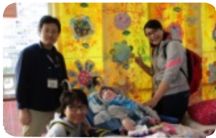
墨東祭にて (先生たちと記念撮影)

十一月二十四日(金)と二十五日(土)に墨東祭があり、かもめ分教室の生徒が全員参加できました。