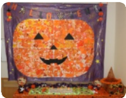
オータムフェスティバル 作品 (二階西病棟)

十月は雨模様の日が続き、気温も低く三十日には木枯らし一号も吹きましました。そんな天候にもめげず、バスハイクや交通機関を利用した外出などの活動を楽しまました。四日のオータムフェスティバルの日は、皆で楽しいひと時を過ごし、又、ウニを素材にした行事食を堪能しました。