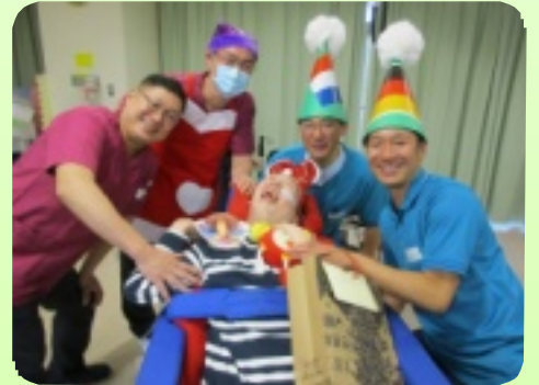
男性に囲まれて・・・