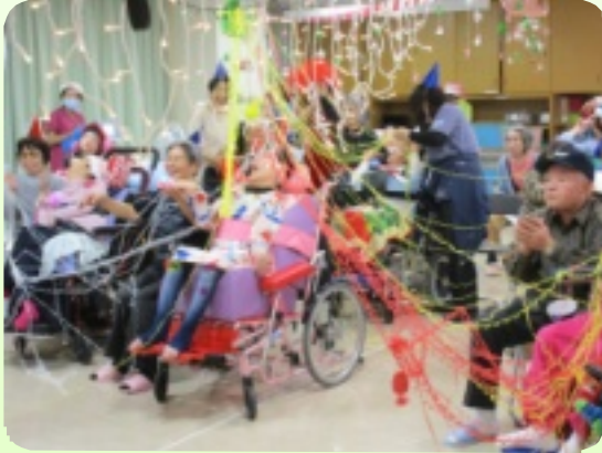
クラッカーでお祝いの様子