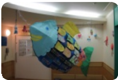
オータムフェスティバル作品『にじいろのさかな』