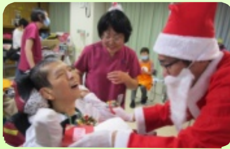
プレゼントももらいました！