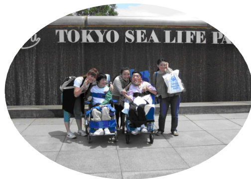
葛西臨海水族園にて

思い思いの一時を過ごしました。利用者様やご家族の皆様との楽しい交流の場となりました。