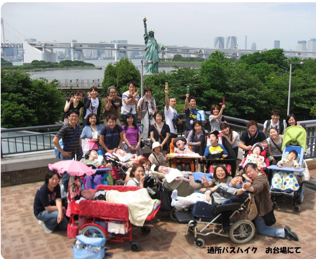
通所バスハイク お台場にて

第十一回 平成二十一年七月一日 発行 東京都立東部療育センター 広報委員会 東京都江東区新砂三三二二十五