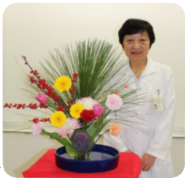
新年の挨拶にて (加我院長)