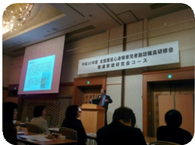
会場のようす （茨城県・水戸市）

十一月三十日から十二月二日の三日間、看護管理研究会コースが水戸市で開催されました。全国百十四施設から百三十五名の看護管理者が参加しました。