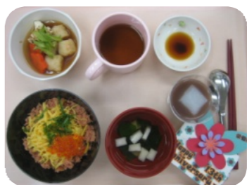
特別メニュー (センター開設記念)

一日はセンターの開設記念日。毎年恒例の栄養科による特別メニュー「鮭いくら丼」「おしるこ風デザート」などを頂いて皆で祝いました。クリスマス会は各病棟、通所それぞれに趣向を凝らし、ご家族やボランティアの皆様、かもめ分教室