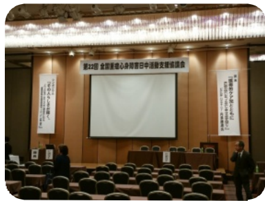
会場のようす （滋賀県・近江八幡市）

シンポジウムでは「滋賀の地域包括支援」についての話でした。滋賀の場合は県全体を七圏域に分けており、施設のない地域も他の市や町がフォローできるようなシステムになっておりひとりももれなく支援を受けられるようになっていました。