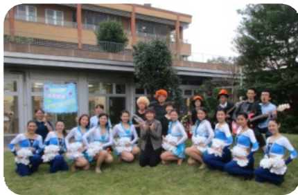
ウイングダンスプロモーション の皆さんと職員バンド

十月十七日(水)に平成最後となる、第十三回オータムフェスティバルを実施しました。