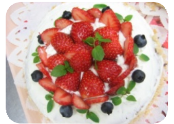
当日、振る舞われたクリスマスケーキ

十二月六日(木)に二階南・三階南病棟が、七日(金)に二階西・三階西病棟でクリスマス会がありました。新人職員の歌劇、利用者の皆様が活躍しているビデオ放映などがあり、応援の手拍子などが鳴り響いていました。三階南病棟では「平成三十年のできごと」のビデオもありました。「おさかな天国」や「だんご三兄弟」の歌が流れると、口々に「そんな年もあったよね」と懐かしがっていました。東日本大震災に触れては「あゝ」と感嘆の声が漏れるなど、悲喜こもごもの企画もありました。