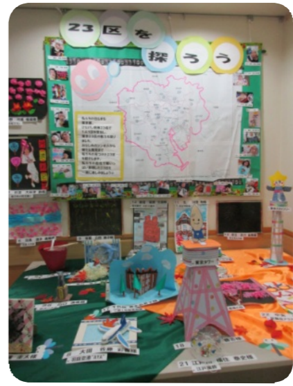
各病棟ごとにテーマを決めて作成した作品